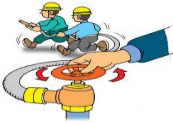
3.밸브를 왼쪽으로 돌린다