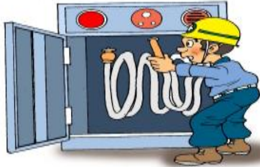
1.문을 열고 호스와 관창을 꺼낸다